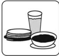
Chế độ ăn kiêng hợp lý