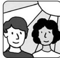
Kiểm soát sự căng thẳng