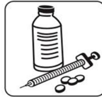
Uống thuốc đều đặn