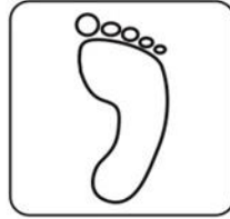
Kiểm tra bàn chân