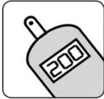
Kiểm tra lượng đường trong máu

9 điều cần làm mỗi ngày để chăm sóc cho bệnh tiểu đường