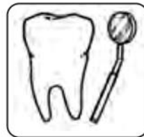
Chăm sóc Răng miệng