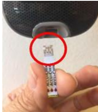
9. 確保金色那邊對準血糖機