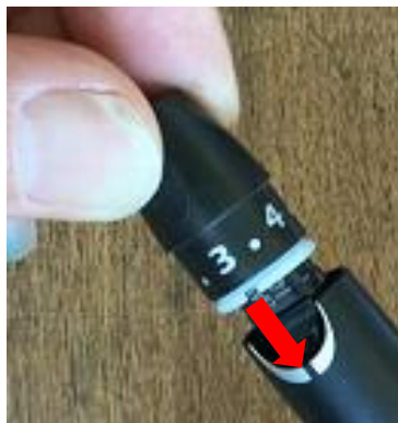
3. 對齊刻度，蓋上蓋子