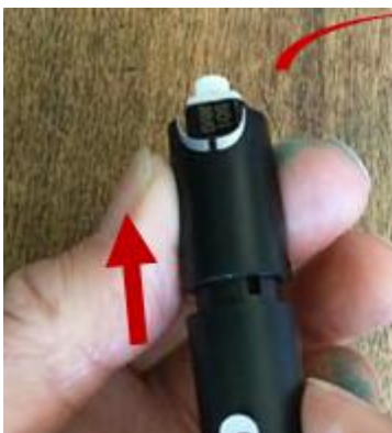
14. 用採血裝置的機身推出 …