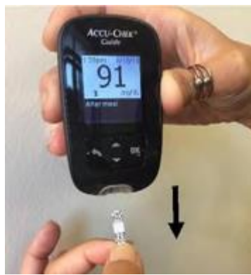
12. 得到測試結果後，拉出測試條即可關閉血糖機