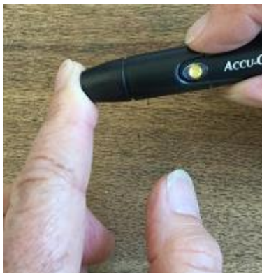
5. 將採血裝置的底端接