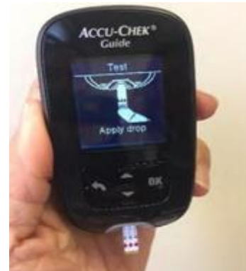
10. 把測試條完全推入。血糖機會自動啟動