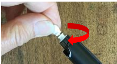
2. 插入採血針，然後將蓋轉開