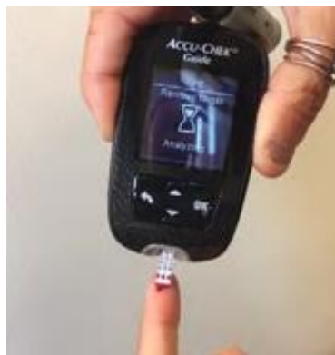
11. 把血液塗在測試條黃色那端任何一處