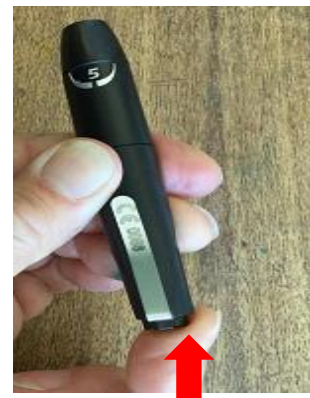
4. 把按鍵壓到底子轉開,像用原子筆一樣