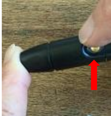
6. 按下黃色釋放鈕穿刺手指