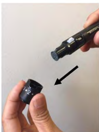
Retire la tapa

Reemplace el tambor después de usar las 6 lancetas: