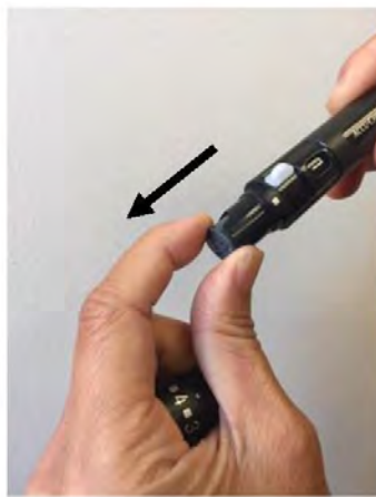
Extraiga el tambor de lancetas