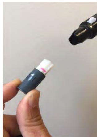
Deseche el tambor usado en un contenedor para objetos punzantes