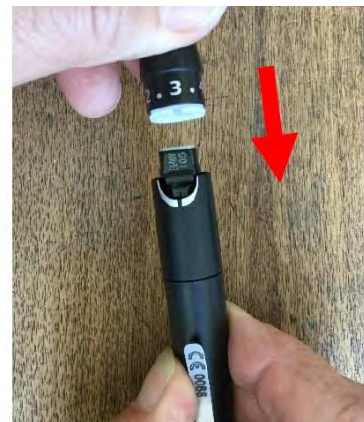
16. Reemplace la tapa. LISTO