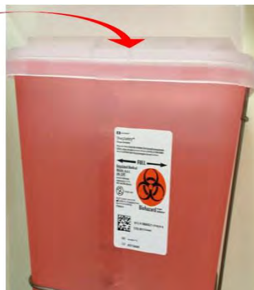
15.....en el contenedor especial para objetos corto- punzantes