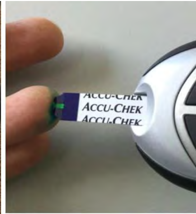
10. Aplique la gota de sangre al espacio amarillo en el extremo de la tira de la prueba