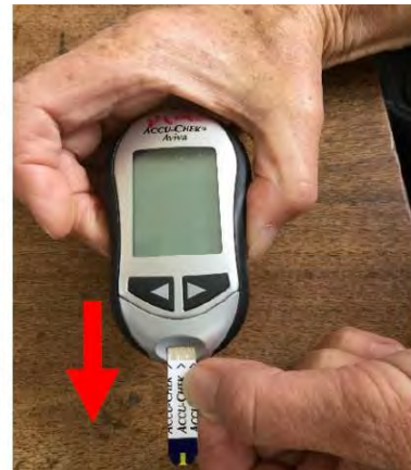
12. Saque la tira de la prueba para apagar el glucómetro