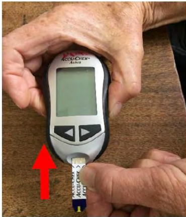
8. Inserte la tira de la prueba para encender el glucómetro