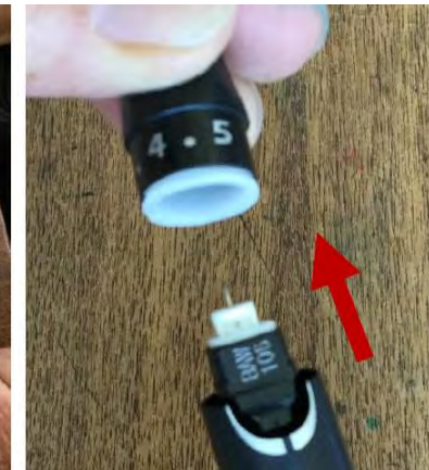
13. Retire la tapa