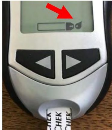
9. Espere hasta ver una gota de sangre que parpadea