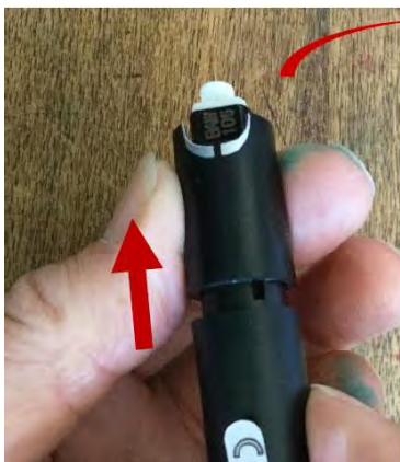
14. Utilice el cuerpo del dispositivo de lanceta para desechar la lanceta...