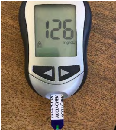
11. Lea su resultado de azúcar en la sangre